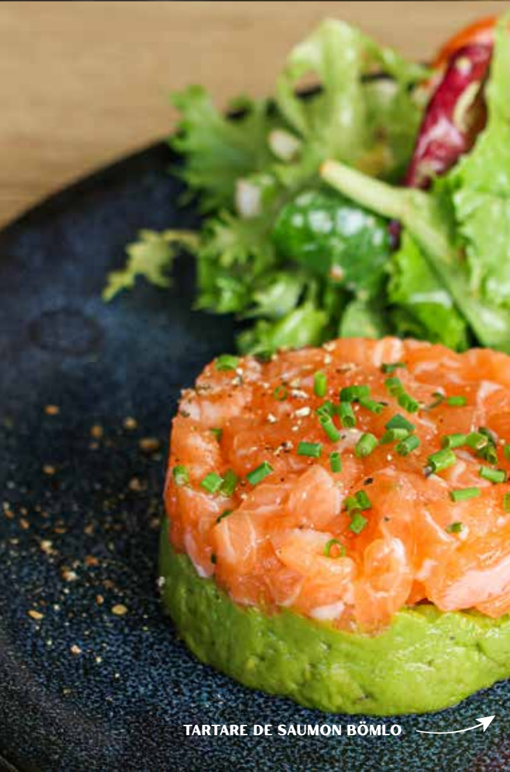
TARTARE DE SAUMON BÖMLO