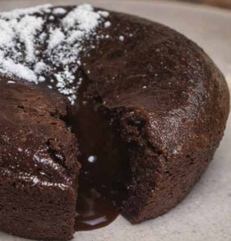
MI-CUIT CHOCOLAT NOIR